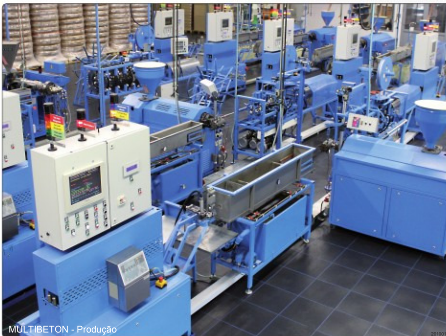
MULTIBETON - Produção